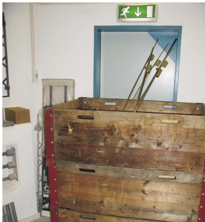
Wer trägt die Verantwortung bei solchen Hindernissen vor einem Fluchtweg? Beachten Sie dazu den Ratgeber auf Seite 17.