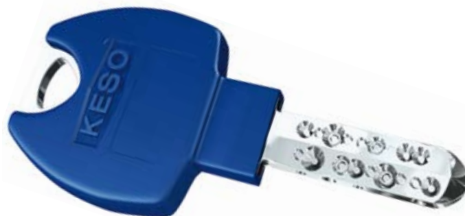
KESO KEK Combi Schlüssel CH

tes wie der Schweiz. In unserem föderalistischen System liegt die Kompetenz hierzu in erster Linie bei den Kantonen. Doch auch der Bund übernimmt eine wichtige Rolle, namentlich in der Bereitstellung von Möglichkeiten zur polizeilichen Kooperation über die Landesgrenze hinaus..