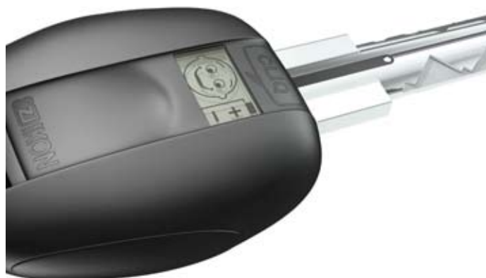
KESO IKON VERSO CLIQ

Rüstungsgüter und besondere militärische Güter wollen sie die Schweizer Sicherheitspolitik auf Kosten Tausender von Arbeitsplätzen der heimischen wehrtechnischen Industrie und ihrer zahlreichen Zulieferer unterminieren.